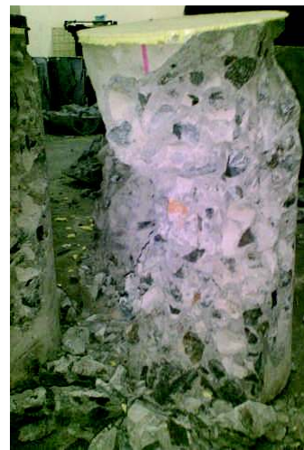
Gambar 1. Keruntuhan beton pasir Kuarsa

Hasil pengujian kuat tekan beton menggunakan pasir Kuarsa diperlihatkan pada Tabel 2. Secara umum proses pembebanan pada pengujian tekan pada silinder beton hingga runtuh dihasilkan perilaku yang sama dengan perilaku beton normal (menggunakan pasir Muntilan), lihat Gambar 1.