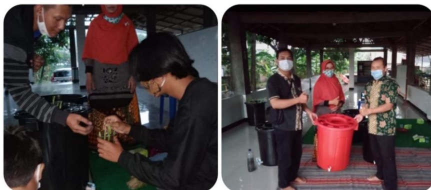
Gambar 2. Praktik dan penyerahan paket budikdamber