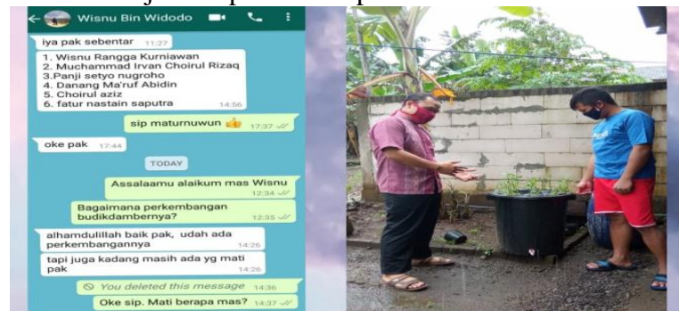
Gambar 3. Monitoring secara online dan offline

dengan baik namun untuk ikan lele terdapat beberapa yang mati. Hal ini dimungkinkan akibat kurang disiplin dalam jadwal pemberian pakan.