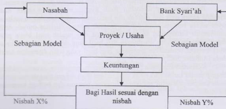
Gambar 2 Skema Kerja Pembiayaan Musyarakah dengan Profit Sharing

Mekanisme revenue sharing dalam perbankan syariah masih diterapkan karena untuk mengikat nasabah penabung dan penyimpan dananya di bank syariah, sebab nasabah ini akan keluar jika tidak memperoleh apa-apa dalam menyimpan atau menabung dananya. Pendekatan ini dilakukan semata-mata ditunjukkan untuk meraih pasar. Keuntungan revenue sharing dalam pembiayaan musyarakah adalah jika usaha yang dibiayai mengalami kerugian bank tidak akan mengalami bagi hasil hingga negatif, bagi hasil terendah bank syariah hanya sebesar nol.