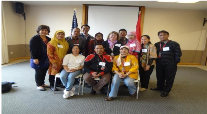
Gambar 1. Kegiatan Sandwich-Like di Northern Illinois University 2012

Pendidikan, beribadah dengan memeluk agama yang taat dan kedekatan keluarga merupakan tradisi kelompok konservatif Amerika pada umumnya. Mereka sudah menanamkan nilai- nilai tersebut kepada anak – anak mereka semenjak usia dini. Nilai- nilai moralitas menjadi sasaran utama kepada anak – anak dengan melibatkan langsung mereka dalam bermasyarakat, seperti sifat optimisme, individualisme (bagaimana bisa bertanggung jawab terhadap diri mereka sendiri) dan menghargai keberagaman (Irfan & Murwantono, 2018)