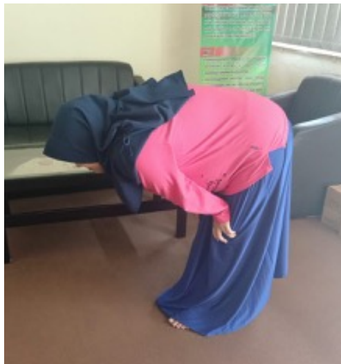
Gambar 2. Ruku' Ibu Hamil

Ketika pada posisi ruku' posisi jantung sejajar dengan otak, posisi ini memungkinkan darah akan terpompa ke batang tubuh bagian atas secara