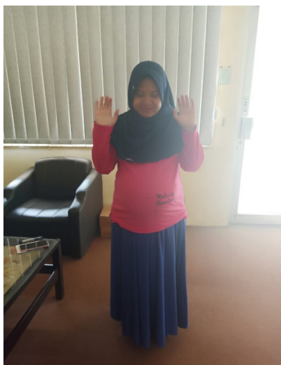
Gambar 1. Takbiratul Ihram Ibu Hamil

pada usia kehamilan 5–6 bulan. Sciatica terjadi akibat pembesaran Rahim sehingga syaraf yang terdapat di area pinggul mengalami sedikit penekanan. Menurut Imam Musbikin, yang mengutip pernyataan Saboe, berdiri tegak sebelum memulai takbiratul ihram merupakan posisi yang sangat berpengaruh terhadap kesehatan. Saat berdiri itu, seluruh saraf berada dalam satu titik di otak. Jika posisi berdiri dilakukan dengan benar maka tubuh akan terbebas dari beban karena pembagian beban itu akan bertumpu pada kaki. Selain itu kedua telapak kaki akan berada pada posisi akupuntur dan ini sangat bermanfaat bagi tubuh.