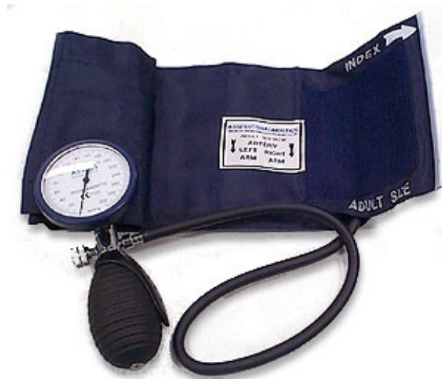
Gambar 2.5 Sphygmomanometer(28)

Apabila responden tidak mampu duduk, pengukuran dapat dilakukan dengan posisi baring, kemudian catat kondisi tersebut di lembar catatan.