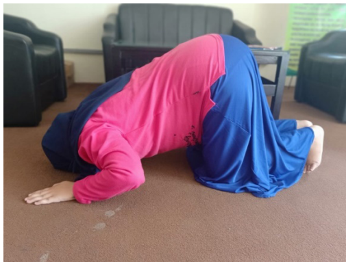
Gambar 2.3: Sujud Ibu Hamil

Ibu hamil yang sedang sujud maka peredaran darahnya akan mengalir ke dalam Rahim sehingga Rahim mendapatkan cukup nutrisi dan makanan bagi janin. Banyaknya darah yang mengalir ke dalam Rahim juga bisa membersihkan polusi di dalam Rahim sehingga janin menjadi lebih steril dan sehat. Oleh karena itu ibu hamil dianjurkan untuk memperpanjang durasi sujud agar aliran darah ke janin semakin banyak.