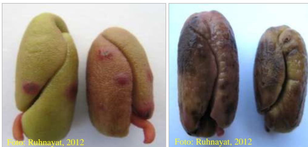
Gambar 4. Biji yang terserang cacar daun cengkeh dan yang cacat tidak boleh digunakan untuk benih