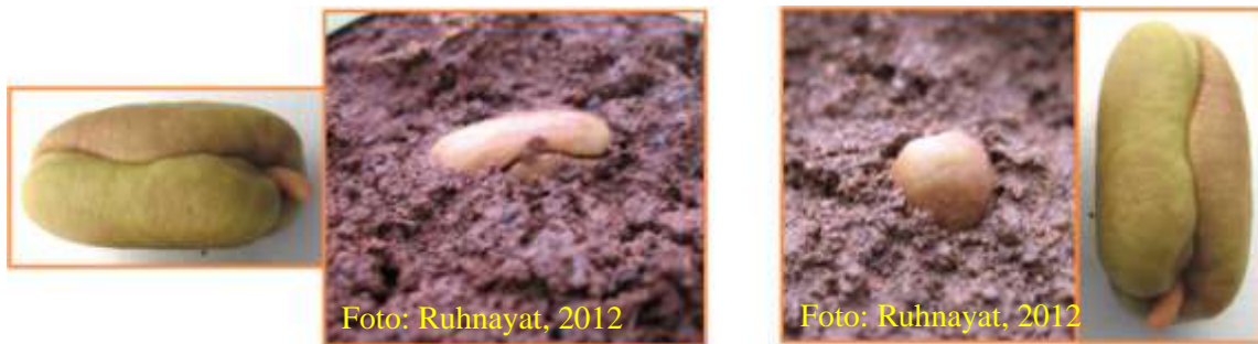
Gambar 9. Cara menyemai benih cengkeh. Benih disemai secara ditidurkan atau berdiri

Penyiraman bedengan dengan air memakai embrat agar pasirnya tidak memadat. Buat lubang tanam dengan diameter 1 cm dan jarak tanam 5 cm x 5 cm dengan kedalaman 5 cm. Benih disemaikan secara ditidurkan atau berdiri. Masukkan benih pada lubang tanam tersebut dengan calon akar langsung menghadap ke bawah sampai permukaannya rata dengan pasir. Siram bedengan dengan air. Penggunaan mulsa dianjurkan, karena akan membantu perkecambahan benih, melindungi pemadatan tanah karena penyiraman, memelihara kelembapan dan suhu agar lingkungan lebih stabil.