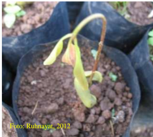
Gambar 20. Benih yang terserang hama rayap, layu kemudian mati