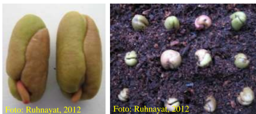
Gambar 7. Penyemaian benih pada media tanam sabut kelapa halus. Benih disemai secara berdiri dengan calon akar berada dibawah

Isi wadah yang terbuat dari plastik/kayu yang telah dilubangi bagian bawahnya dengan sabut kelapa yang telah dihaluskan. Wadah yang digunakan mempunyai ketinggian 25-30 cm, agar akar benih tumbuh lurus. Untuk menghemat tempat, benih disemai secara berdiri dengan jarak tanam 2 cm x 2 cm. Calon akar menghadap ke bawah dengan permukaan benih bagian atas hampir rata dengan media tanam.