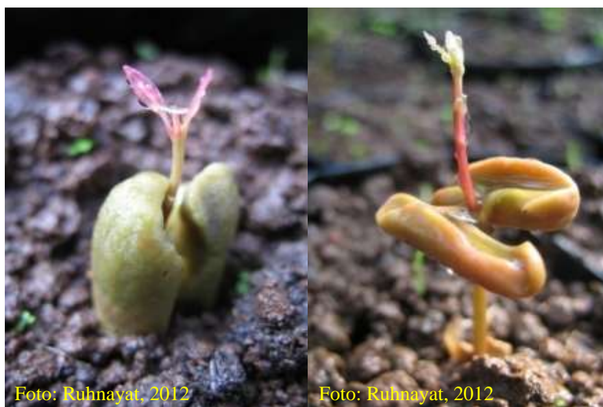
Gambar 10. Benih akan tumbuh setelah 2-3 minggu ditanam

Benih akan tumbuh 2-3 minggu setelah semai, benih yang tumbuh setelah 3 minggu sebaiknya dibuang karena kualitasnya kurang baik. Untuk mencegah penyakit cacar dan bercak daun, benih disemprot dengan fungisida 3 g/liter air setiap 10 hari sekali. Setelah berumur 1-2 bulan benih siap dipindahkan ke bedengan pembenihan.