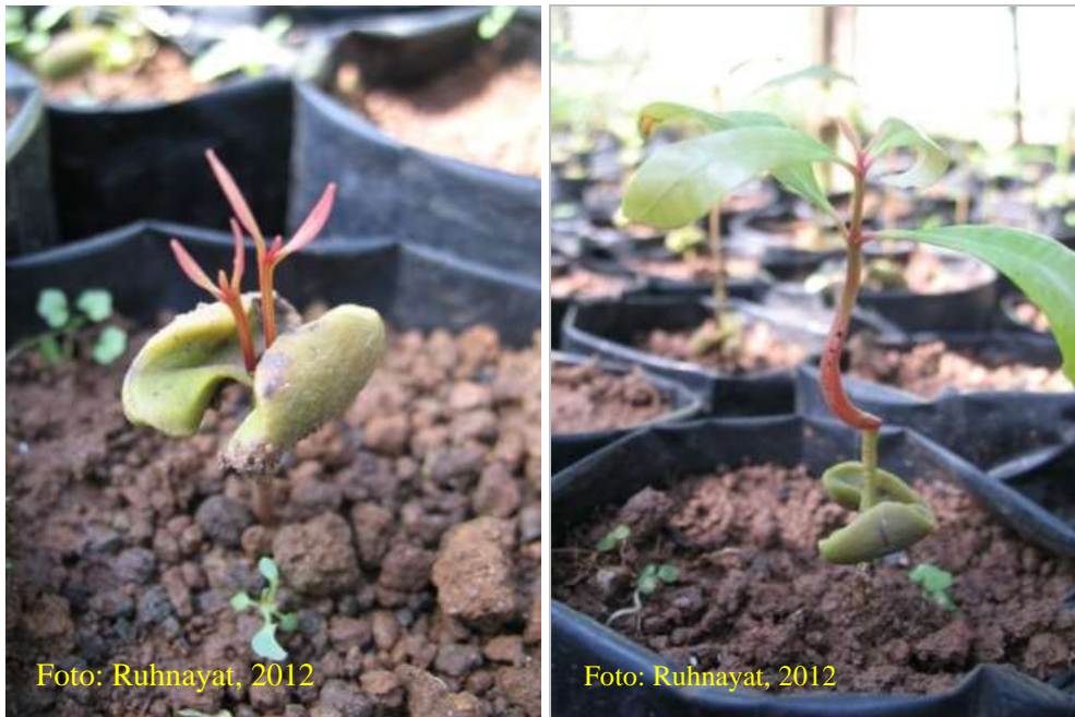
Gambar 21. Benih yang pertumbuhannya kurang baik segera disulam