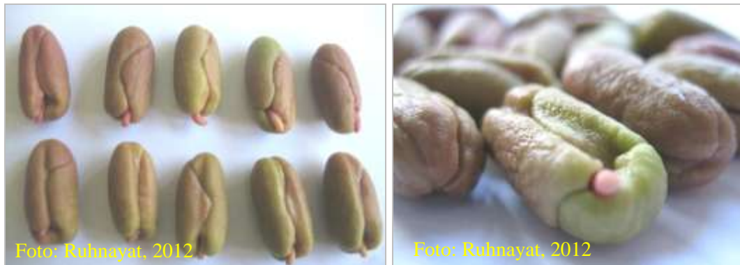
Gambar 3. Benih yang sehat siap disemai