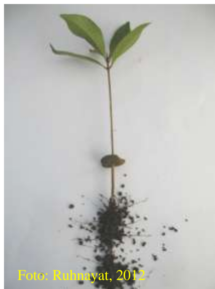
Gambar 13. Pemindahan benih dilakukan secara hati-hati, akar jangan terputus dan tanah tetap melekat pada akar

Pemindahan benih harus dilakukan secara hati-hati, diusahakan akar tidak rusak/putus, dan tanah/pasir yang melekat di permukaan akar jangan dibiarkan rontok agar benih tidak mengalami stres pada waktu ditanam di pembenihan.