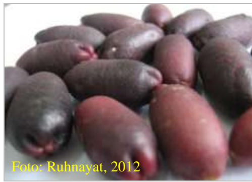
Gambar 2. Buah cengkeh yang telah masak fisiologis berwarna coklat kehitaman