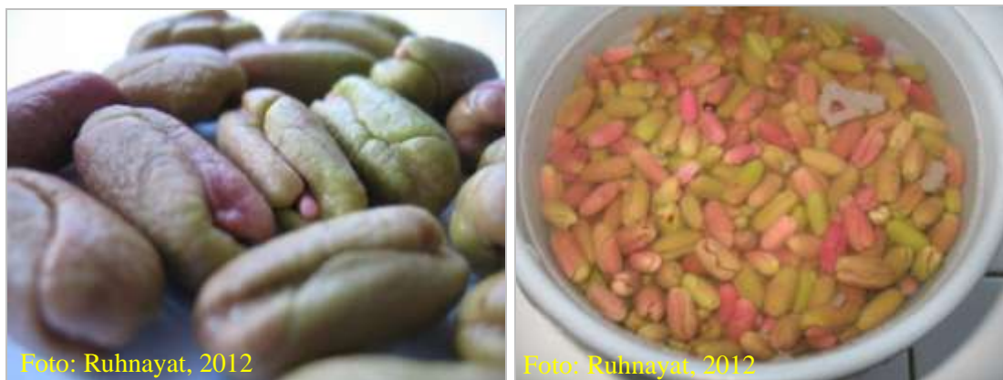
Gambar 6. Benih cengkeh yang telah dikupas kulit buahnya, direndam dalam air bersih selama 24 jam