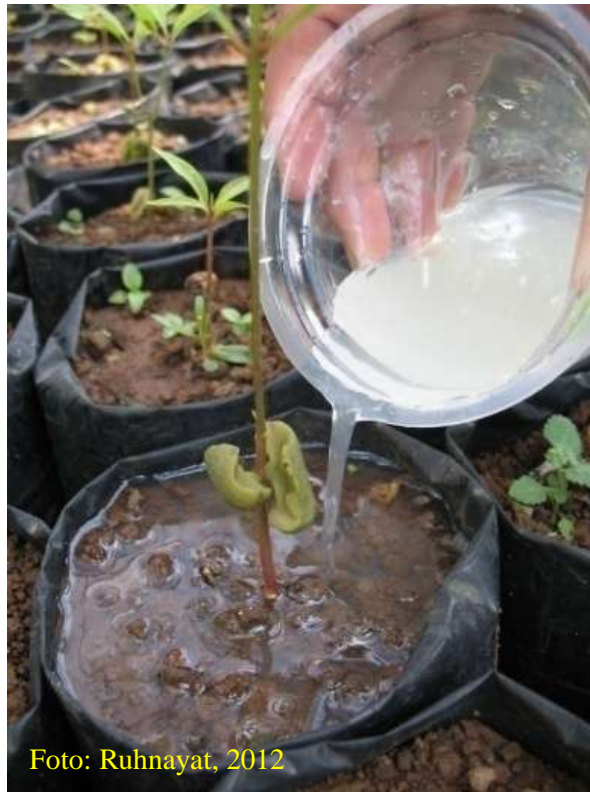
Gambar 19. Media tanam disiram dengan insektisida untuk mencegah serangan hama rayap