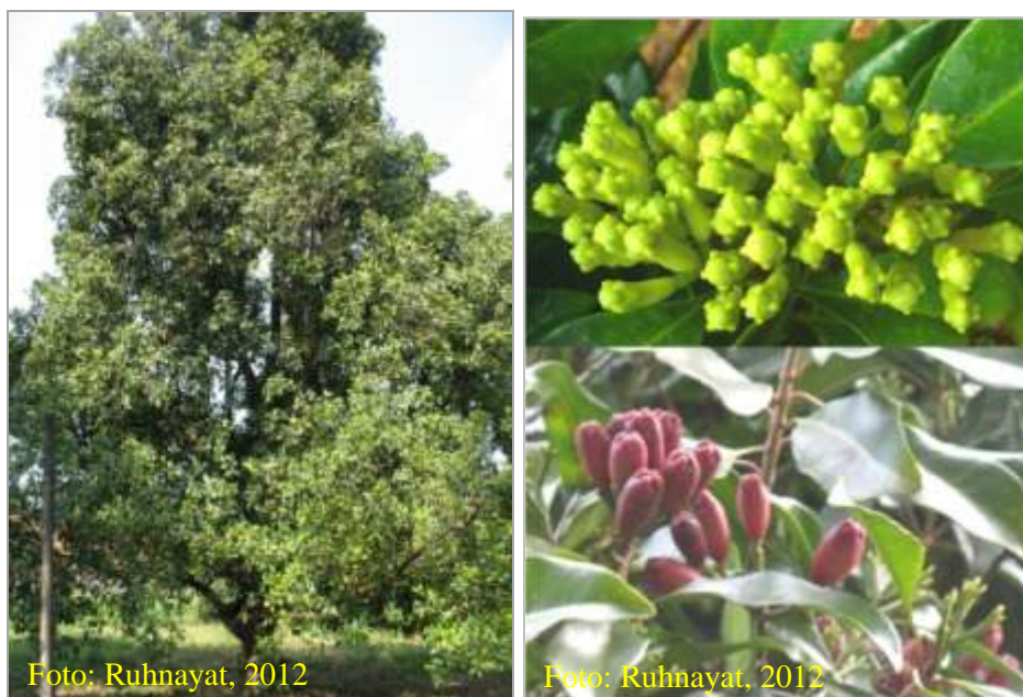
Gambar 1. Pohon induk cengkeh dengan percabangan, bunga, dan buah yang lebat