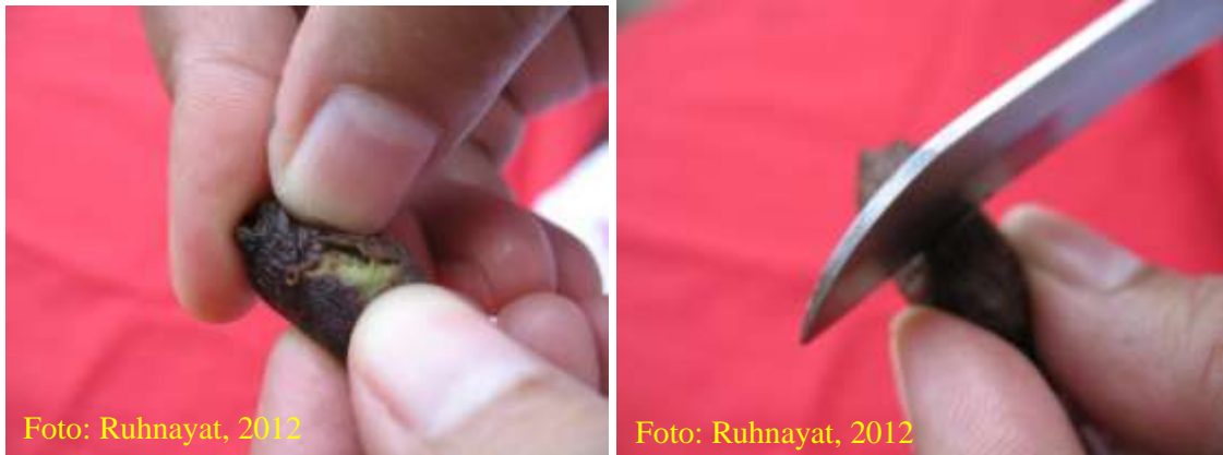
Gambar 5. Pengupasan kulit buah dilakukan dengan hati-hati dengan menggunakan tangan atau pisau

yang tidak terlalu tajam. Setelah dikupas benih direndam dalam air bersih selama \pm 24 jam untuk meningkatkan kadar air, dan dilanjutkan dengan pencucian untuk menghilangkan lendir yang menempel pada benih. Selama pencucian benih diaduk dan digosok-gosok dalam air secara hati-hati untuk mempercepat hilangnya lendir yang menempel pada permukaan benih, air cucian diganti sebanyak 2-3 kali. Benih cengkeh yang sudah dibersihkan harus segera disemai.