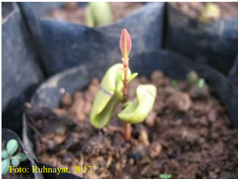
Gambar 14. Benih umur 2 minggu yang baru dipindah ke polibag