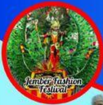
Jember Fashion Festival

Harmonisasi Spirit Kebhinekaan (Pendalungan) untuk Penguatan Profesionalitas Akuntan Menuju Indonesia Jaya