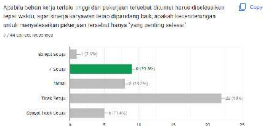
Gambar 2. Hasil Kuesioner Tambahan Pertanyaan Beban Kerja

Pada hasil kuesioner tambahan yang dilakukan didapatkan sampel sebanyak 44 responden dari 76 populasi sampel sebelumnya yaitu sekitar 58%. Hal ini terjadi karena tidak semua responden berkenan mengisi kuesioner tambahan ini. Berikut hasil kuesionernya :