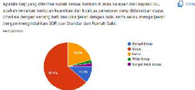
Gambar 3. Hasil Kuesioner Tambahan Pertanyaan Mengenai Gaji