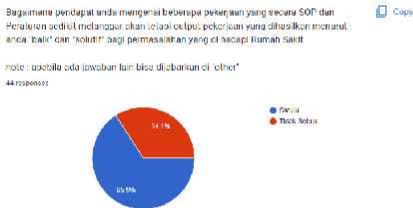
Gambar 4. Hasil Kuesioner Tambahan Pertanyaan Potensi Pelanggaran SOP